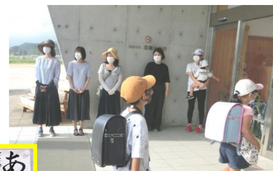
PTA育成委員会「あいさつ運動」