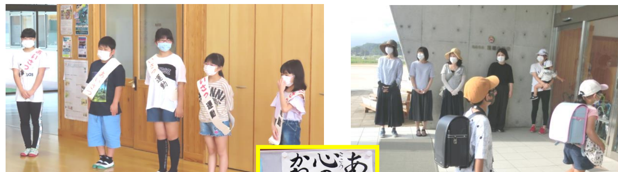
児童会・生活委員会「あいさつ運動」

2学期の目標「自分の花を咲かせよう」これは、なりたい自分を見つけて、こつこつと努力を続ける子どもたちに育ってくれることを目指しています。目標に向かって、行動する姿を「褒めて・認めて」、一人一人の自信を育てていきます。ご家庭におかれましても、お子さんをたくさん褒めていただき、励ましの心でエネルギーがいつも満タンになるように支えていただきますようお願いいたします。