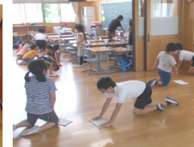
6年生が1年生の掃除のお手伝い