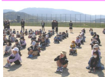
令和2年度1学期始業式