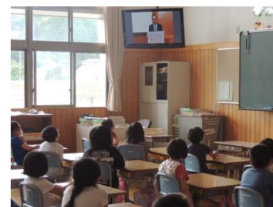
学校再開 校長あいさつ