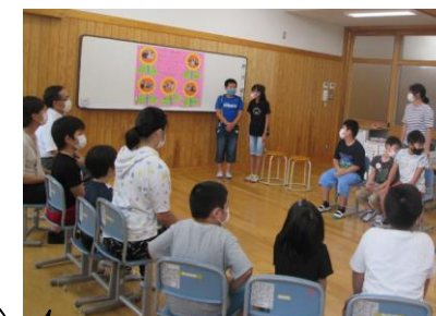
ひまわり学級 開級式