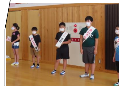
朝の「あいさつ運動」