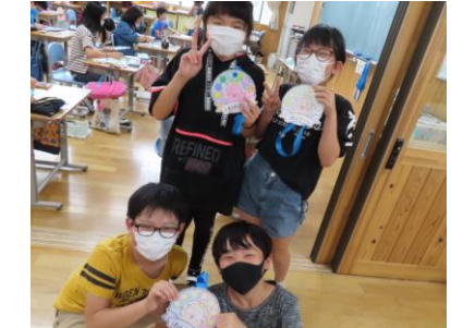
新1年生へ「歓迎のプレゼント」