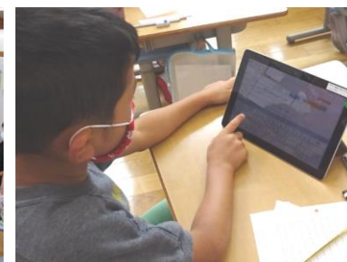
タブレットを使っでの学習