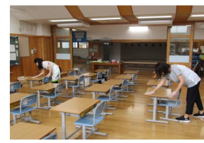
コロナ対策 校内消毒