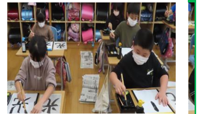
書写 筆使いが上手になってきました。