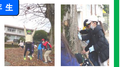
生活科 旧千手小のケヤキを見学しました。