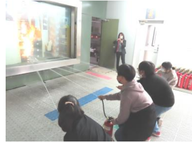
防災センター 消火活動を体験