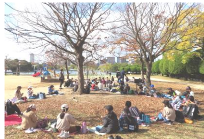
秋の大濠公園 みんなで楽しくお弁当タイム

次に、福岡市防災センターでは、消火活動や地震や強風の体験をして、教科書だけで分らなかったことを聞いて、学びを深めることができました。子ども達は、時間を守り、しっかりと集団行動をがんばることができていました。4年生の成長を感じました。