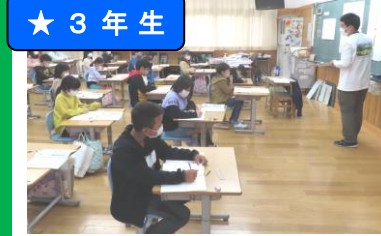
算数 順序よく計算する学習をしています。