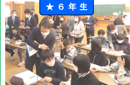
プログラミング学習 本校は研究先進校として県教育委員会から視察がありました。