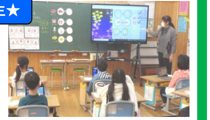
プログラミング学習 カスタを使って楽しく学習しました。