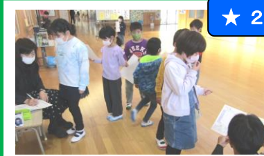
算数 かけ算九九の習熟を図っています。