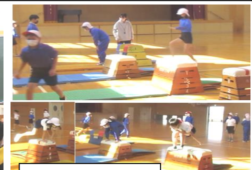
とび箱運動の学習