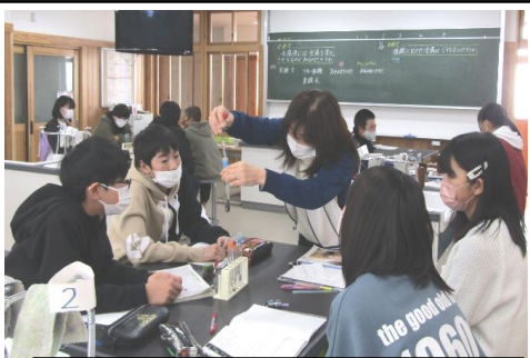
水溶液の性質を調べる学習