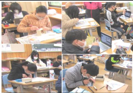
卒業記念 オルゴールケース作りの学習

最高学年として、大活躍してくれました。卒業までの目標をたて、残り少ない小学校生活の一日一日を大切に過ごしています。