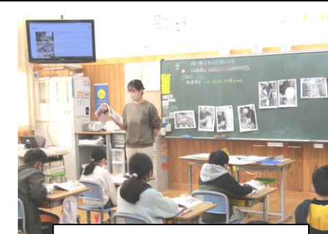
小石原焼のまちづくりの学習

素直な心で勉強や様々な活動に意欲的です。授業中は、よく聞き、よく考え、発表したり、書いたりして力をつけています。