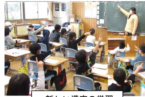
新しい漢字の学習

しっかりと先生や友だちの話を聞き、真剣に考える子どもに育ちました。自信あふれる言動が数多くみられるようになりました。