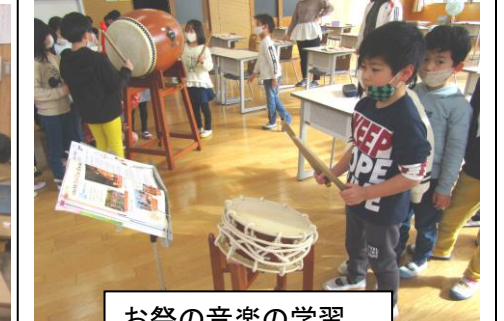
お祭の音楽の学習