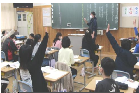
感謝の心を学ぶ学習