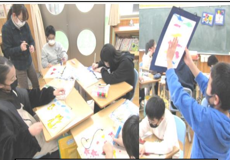
光のさしこむ絵を作る学習

6年生の姿を引き継ぎ、期待に応えようとする熱いエネルギーを感じます。たくさんの方々の場面で活躍を期待しています。