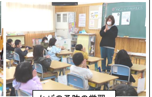
かぜの予防の学習