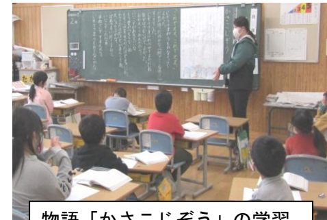
物語「かさこじぞう」の学習

いつも明るく元気な2年生は、いろいろな学習や活動に取り組み、立派なお姉さん、お兄さんの姿として成長しています。