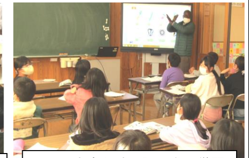
クリス先生と外国語活動の学習