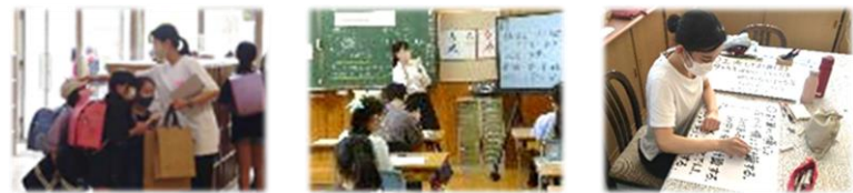
近い将来、素敵な先生になられることを、みんなで応援しています!!

本校の子どもたちにとっても、自分たちの先輩であるお二人の頑張っておられる姿に間近に接することができるというのは、自分たちの将来を考える上でも、とても貴重な機会になっていると思います。それぞれ4週間という限られた時間ですが、一緒に学習・活動したり、遊んだりしながら、たくさん学び、たくさん素敵な思い出をつくらせてほしいなと思います。